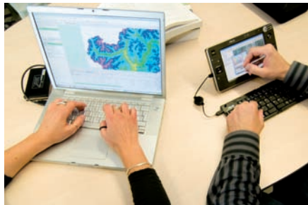
Sistema Hydrologis per la registrazione digitale dei dati geografici.

La registrazione dei dati geografici sul campo da parte di geologi, ingegneri, architetti e altri professionisti è ormai