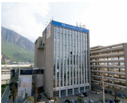
TIS Innovation Park.

TIS Innovation Park kareen.raynaud@tis.bz.it www.tis.bz.it