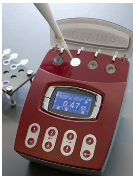
Il biosensore DiVino.

La società incubata nel TIS 3CI, in collaborazione con l'Università di Padova, ha recentemente sviluppato il biosensore DiVino, uno strumento di misurazione di vino, mosti e stucchi. Tramite un metodo di misura enzimatico brevettato, l'enologo avrà a disposizione un unico strumento per misurare le caratteristiche del vino. Durante il processo che va dalla raccolta dell'uva all'imbottigliamento del vino, è infatti necessario controllare i diversi parametri per ottenere il prodotto desiderato. Gli elementi da tenere sotto controllo sono molteplici e possono essere suddivisi in due grandi gruppi: parametri ambientali (temperatura, umidità eccetera) e parametri analitici (glucosio, fruttosio, zuccheri riduttori, etanolo, acido malico, acido lattico, acidità totale, etanolo, anidride solforosa, botrite, polifenoli totali). Il biosensore DiVino è concepito come uno strumento di misura enologica che permette al vinificatore di monitorare in qualsiasi momento del ciclo di produzione lo stato del processo, ottenendo informazioni sulla trasformazione malolattica, gli zuccheri riduttori e l'alcool etilico. Lo strumento, semplificando il metodo di misurazione, permette di ottenere risparmi in termini di tempi e costi, ed è costituito da tre elementi fondamentali: sensore elettrochimico (biosensore), elet-